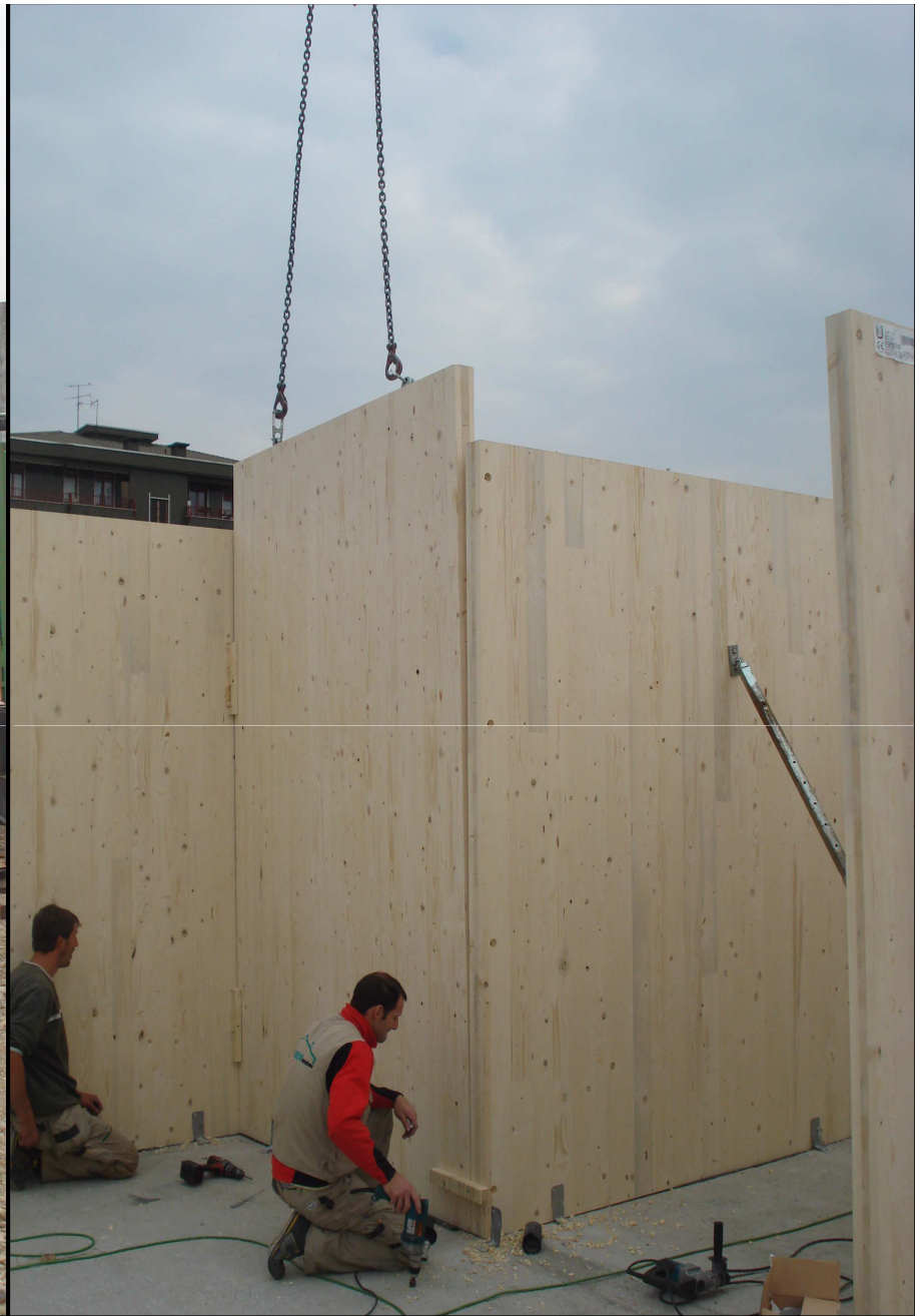
ANCORAGGIO DELLA PARETE