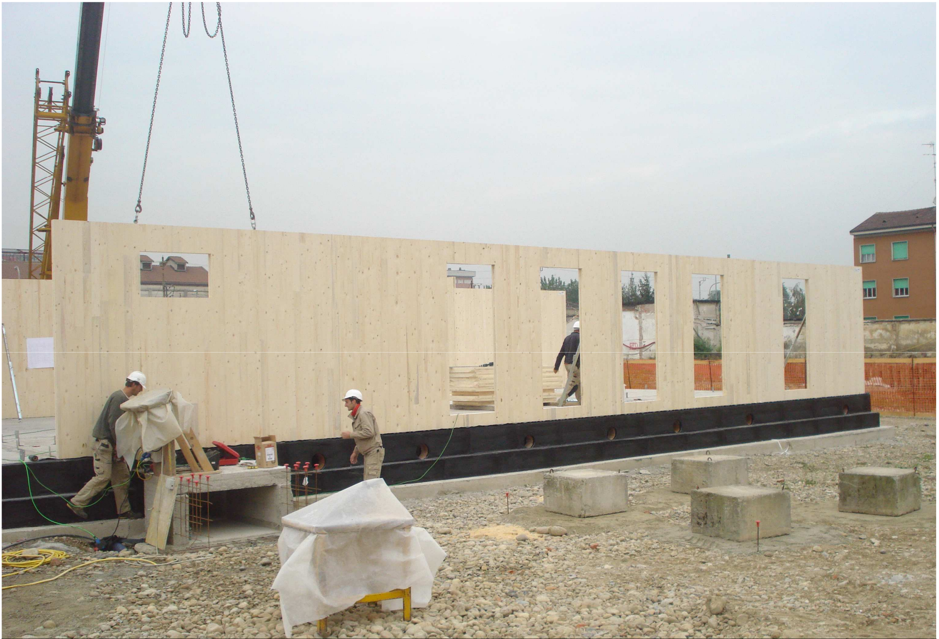
POSA DELLE PARETI