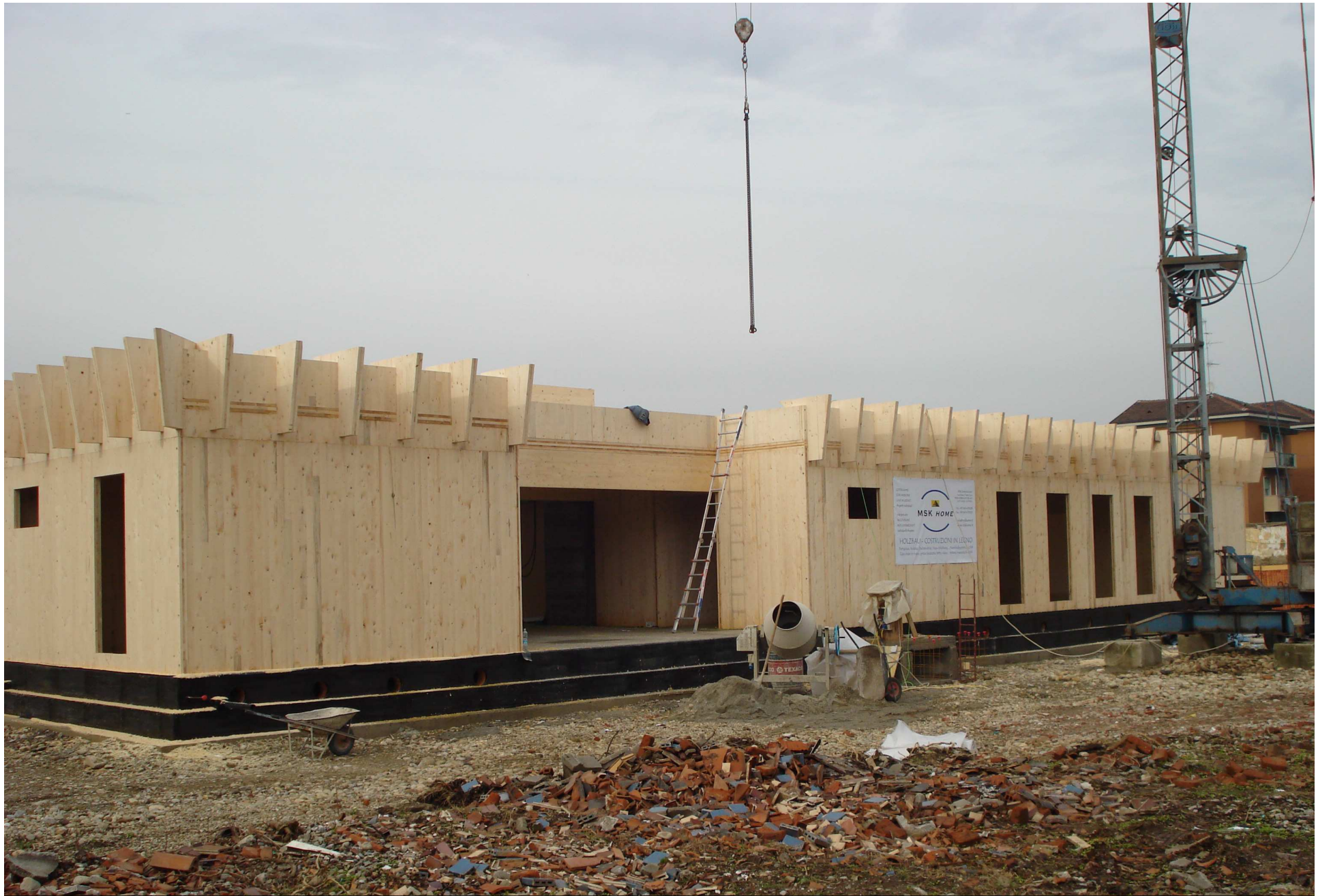
PANORAMICA DELLA STRUTTURA